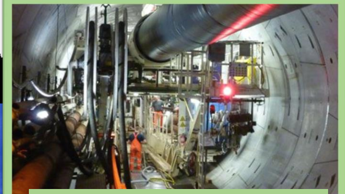
Neubau der U-Bahnlinie U5

Kosten: 150 € 50 € Anzahlung bei Anmeldung Anmeldung bei: Jonas Willing Raum 323/4 (willing@geotechnik.rwth-aachen.de)