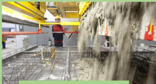
Fertigteilewerk Max Bögl